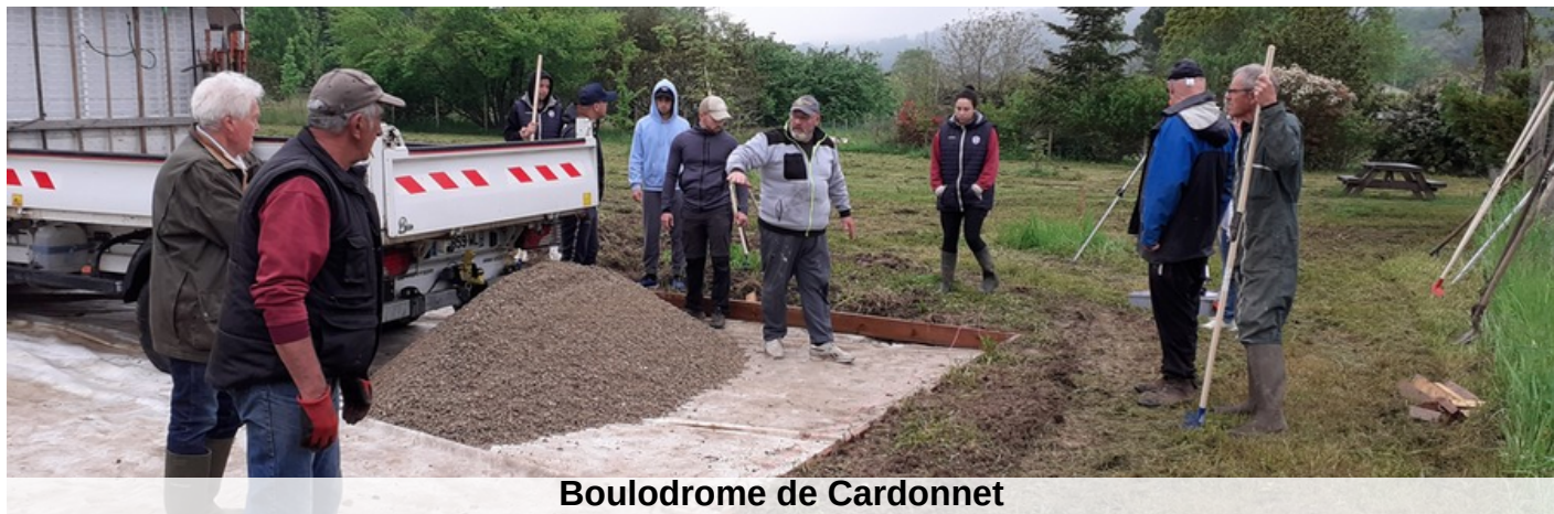
Boulodrome de Cardonnet

Ces terrains, construits par les membres du comité des fêtes de Cardonnet en collaboration avec la mairie de Saint-Hilaire-de-Lusignan, accueilleront une nouvelle activité : les Pétanquades. En effet cette activité estivale du 29 juin au 27 juillet, est à l'initiative de nouveaux jeunes du comité. Pendant plusieurs week-ends, les membres du comité et les jeunes ainsi que des bénévoles se sont retroussés les manches afin d'être prêts pour le jeudi 29 juin, date du premier concours de pétanque.