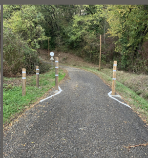
Route de Lusignan