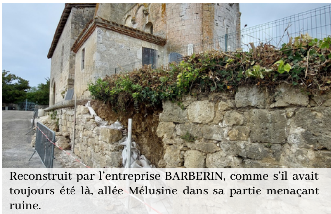
Reconstruit par l'entreprise BARBERIN, comme s'il avait toujours été là, allée Mélusine dans sa partie menaçant ruine.