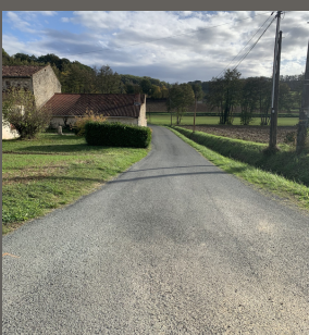
Route de Redon