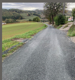
Route de Chabrières

En raison des risques d'effondrement, un rétrécissement a été mis en place sur la route de Lusignan et réfection des routes de Chabrières et Redon.